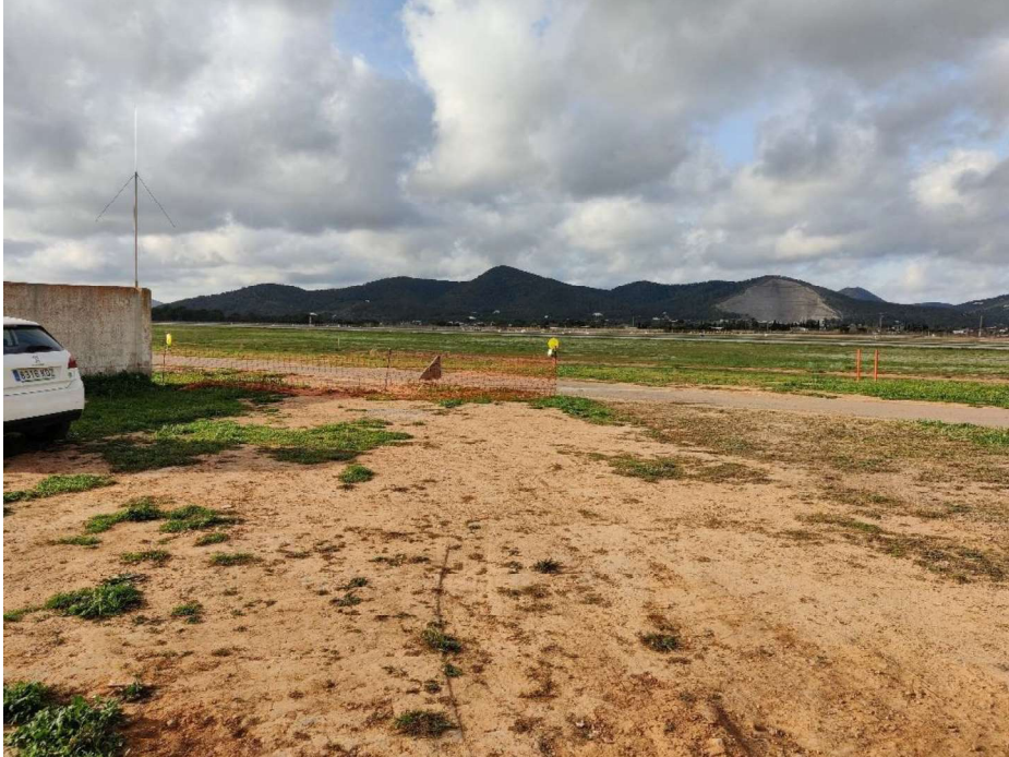
Jalonamiento de la obra