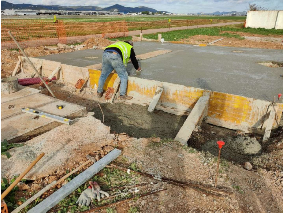
hormigonado de zapatas y arquetas a sustituir