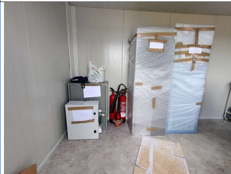
Interior de oficina de obra. Extintores