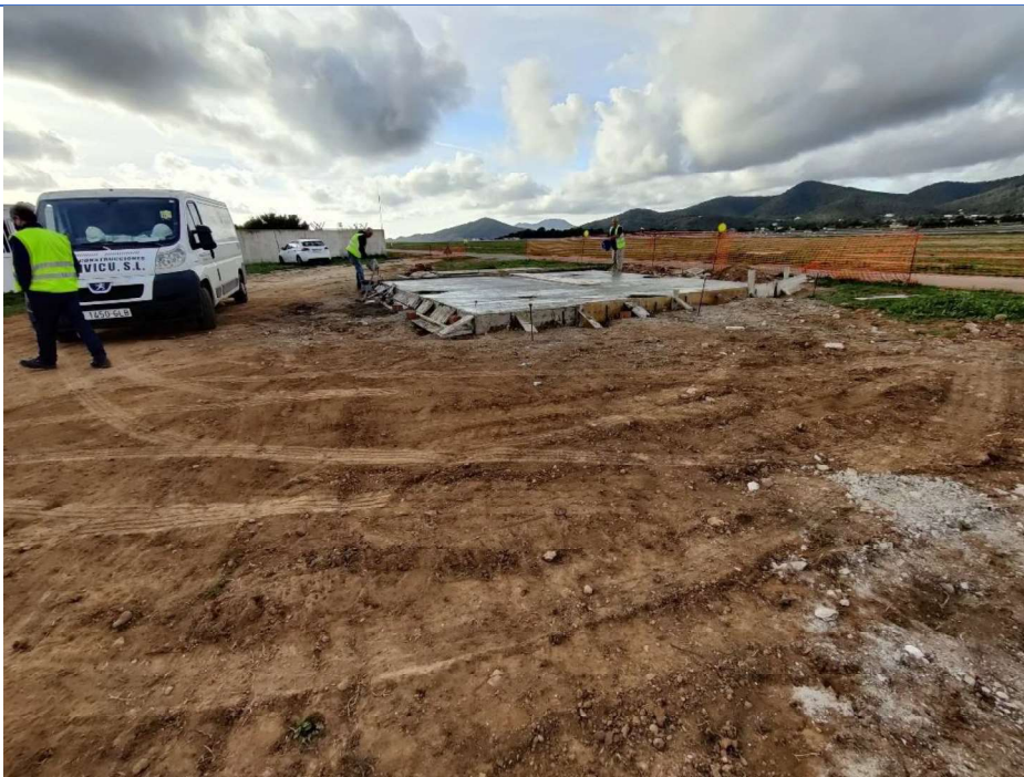
Aspecto general de la zona de trabajo