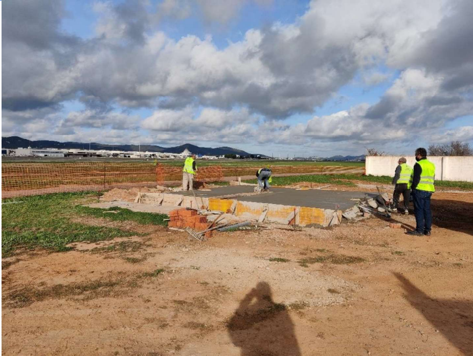
Trabajos de hormigonado de zapatas. Aspecto general de la zona de trabajo