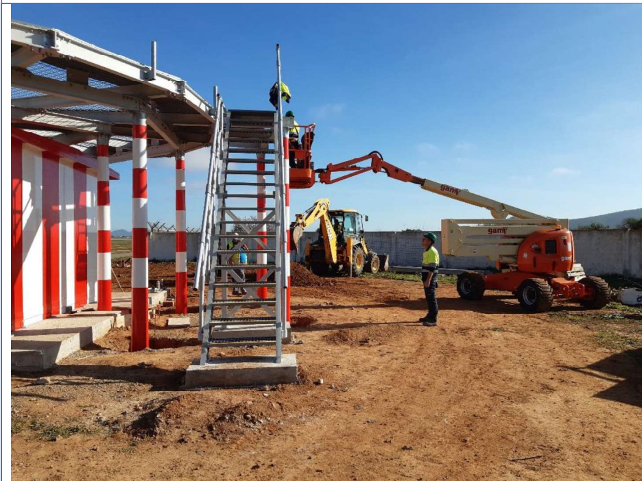
Montaje de estructura