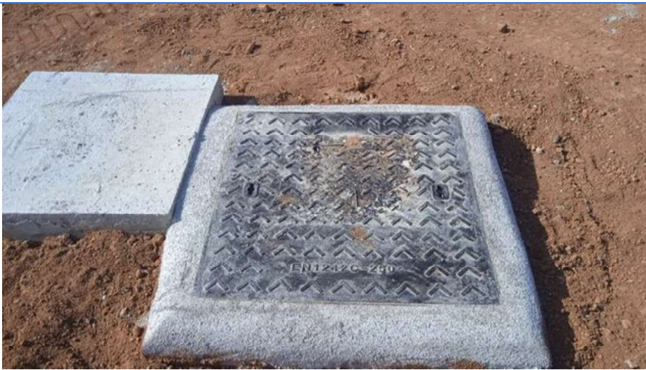
Arquetas nuevas y tapas