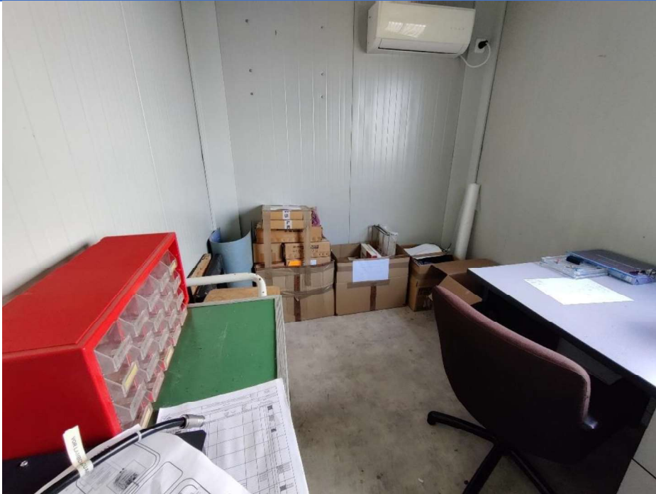
Interior de oficina de obra. Acopio de equipos electrónicos