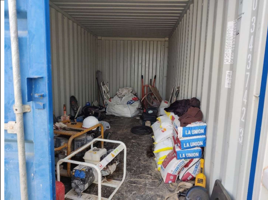
Contenedor de materiales y medios auxiliares. Grupo electrógeno