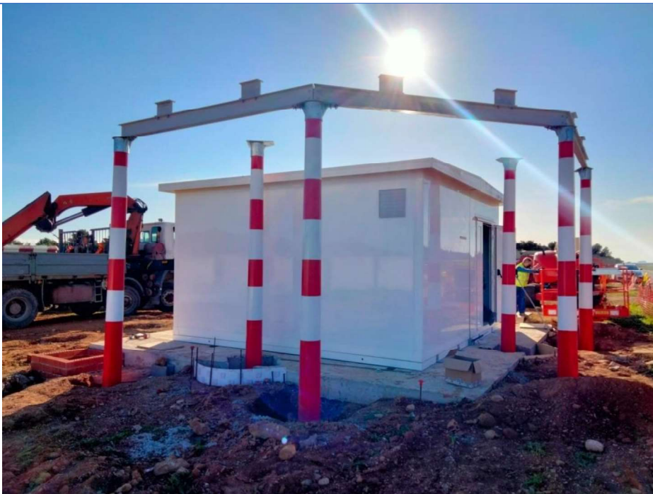
Descarga de caseta y montaje de mástiles contraantena