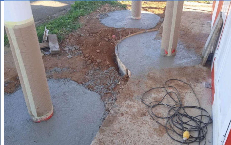
Hormigonado de mástiles