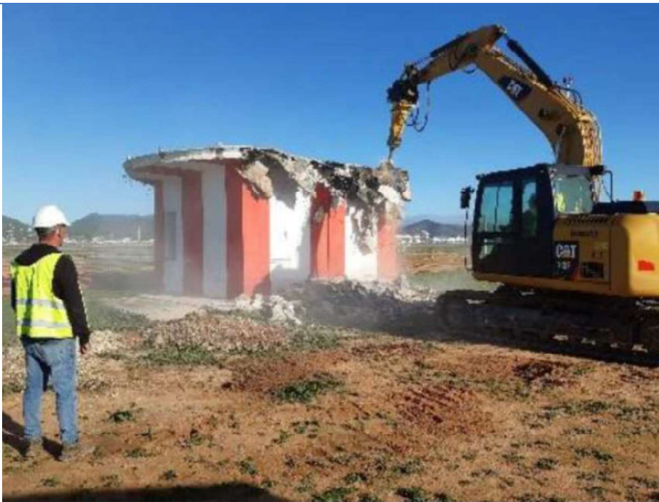
Demolición caseta VOR