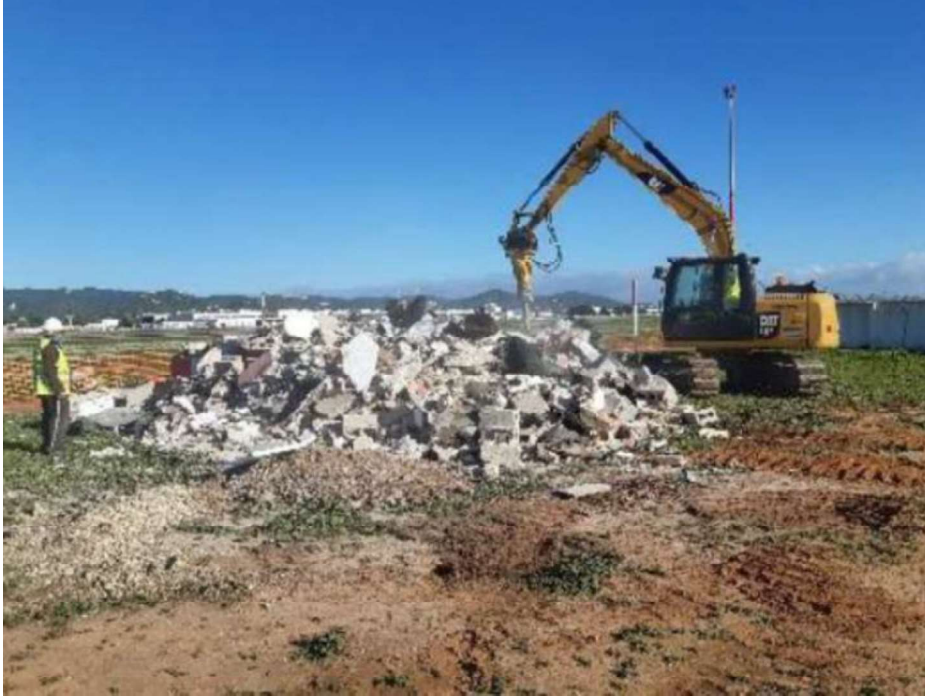
Demolición caseta VOR