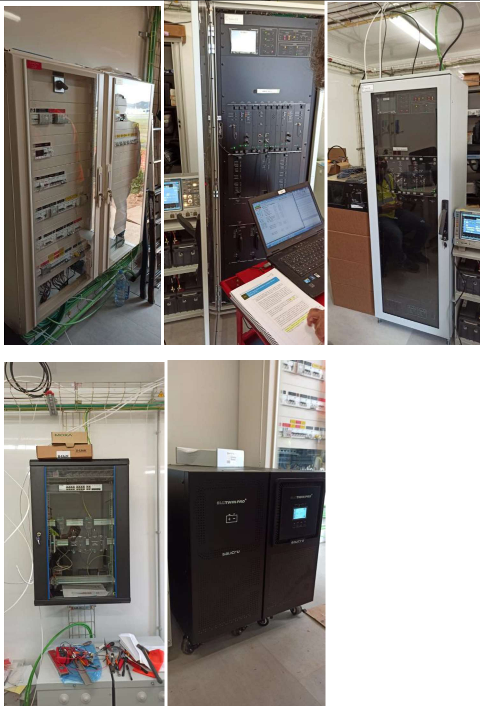
Instalación interior: cuadros, equipos, rack y saís