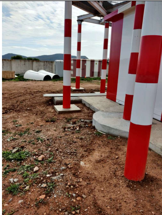
Cimentaciones y pilares