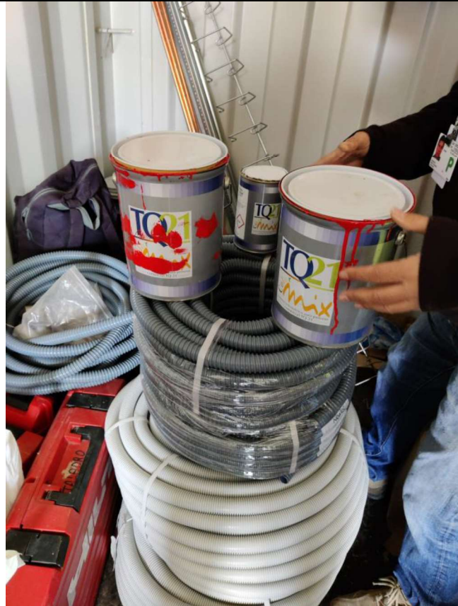
Interior del contenedor de acopios: envases de pintura.