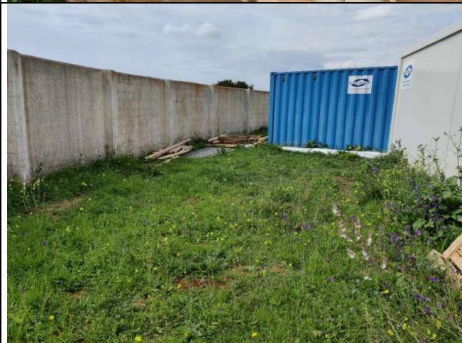
Restos pendientes de recoger