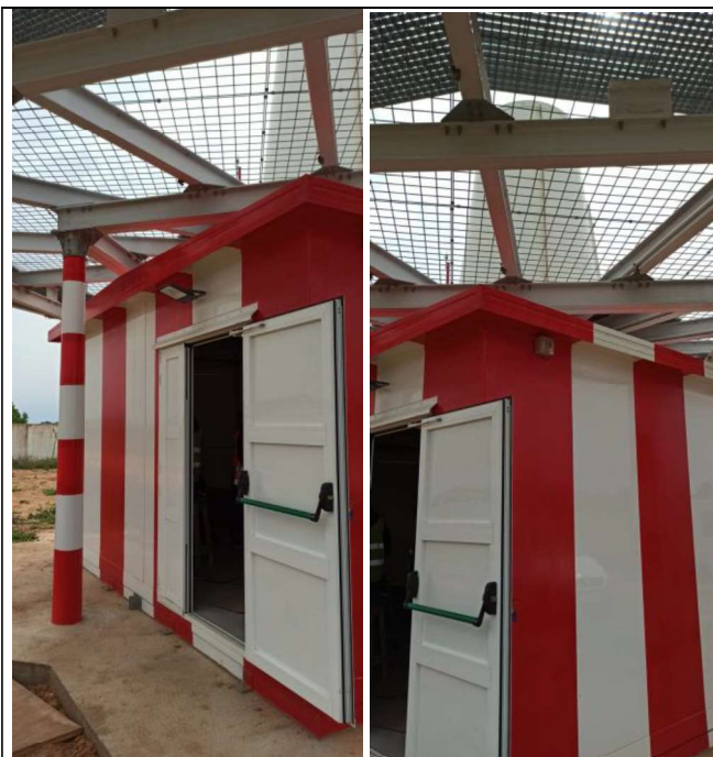
Exterior de la caseta y luminarias