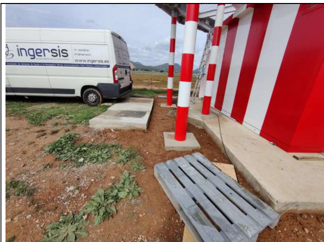
Cimentaciones, pilares y arquetas