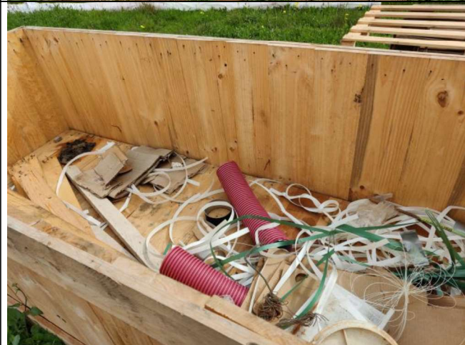
Contenedor de residuos.