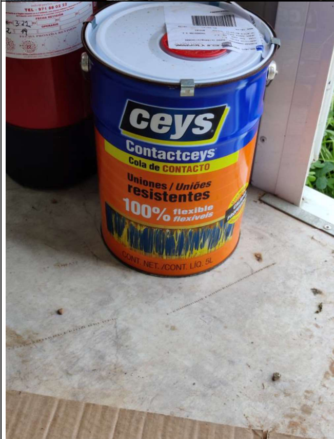
Interior de la caseta de obra: envase de pegamento