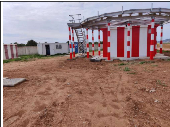
Vista del VOR construido, escalera de acceso e instalaciones auxiliares de obra.