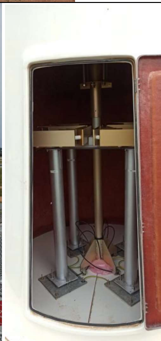
Antena CVOR y radomo