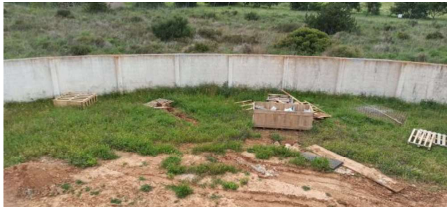
Caseta de obra, restos, contenedor y aspecto general de la zona de obra