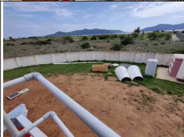
Emplazamiento de la obra. Muro que separa la obra del espacio natural protegido. Acopio del pararrayos y radomo. Contenedor de residuos.