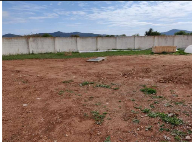
Muro de separación.