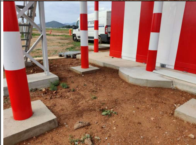
Cimentaciones y pilares