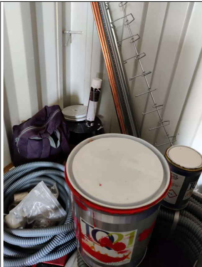
Interior del contenedor de acopios: envases de pintura y aerosoles.