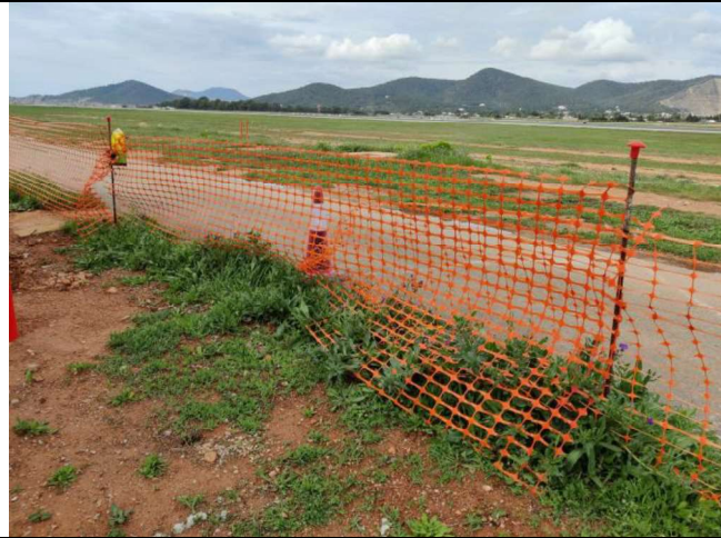
Detalle del jalonamiento y señalización.