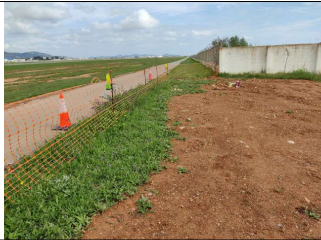
Detalle del jalonamiento y señalización.