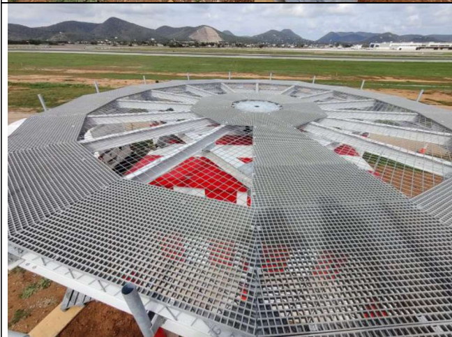
Vista superior de la contraantena