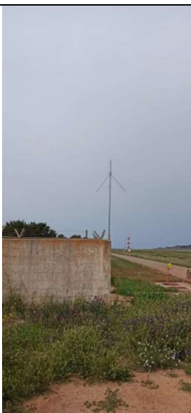
Antena para calibración