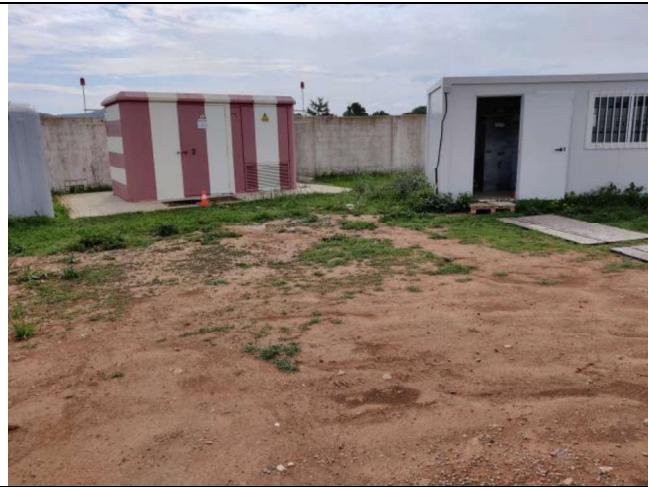
Centro de transformación y caseta de obra