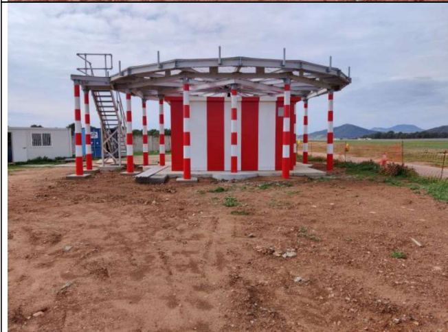
Vista del VOR construido, escalera de acceso e instalaciones auxiliares de obra.