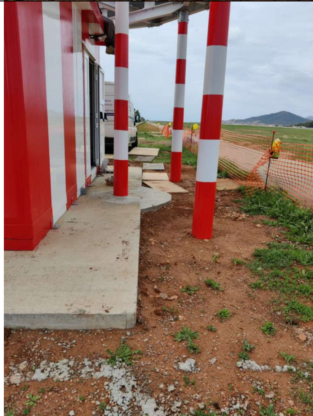
Cimentaciones y pilares