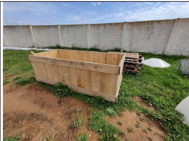
Contenedor de residuos.