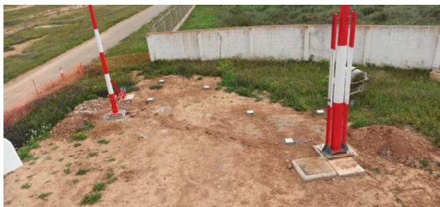
Antena DME, pararrayos y arquetas