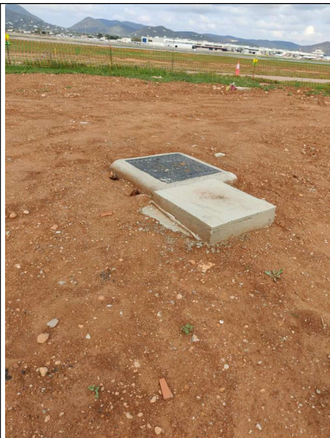
Arqueta y base del pararrayos