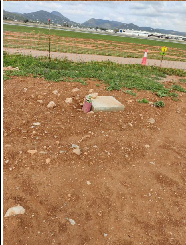
Base de la antena DME