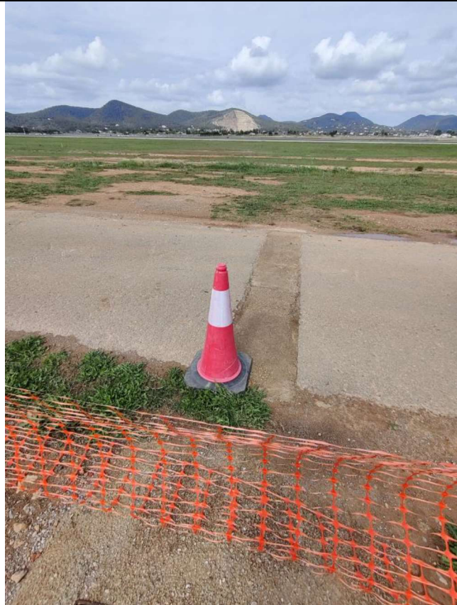
Señalización de obra en la vía de acceso