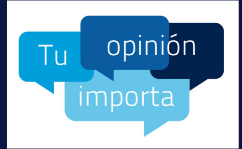
Imagen de la campaña de Cultura de Seguridad en ENAIRe "Tu opinión importa"

Como continuación del Clip de Seguridad 28 "Cultura de Seguridad en ENAIRe", en este clip hablamos del survey que ha tenido lugar recientemente para medir nuestra Cultura de Seguridad. El survey o encuesta es la herramienta utilizada para esta medición, a través de los cuestionarios y los grupos de debate se identifican las áreas de mejora y buenas prácticas y nos permite comparar resultados con las anteriores mediciones. En este Clip mostramos los resultados obtenidos este año y la evolución durante los últimos 5 años.